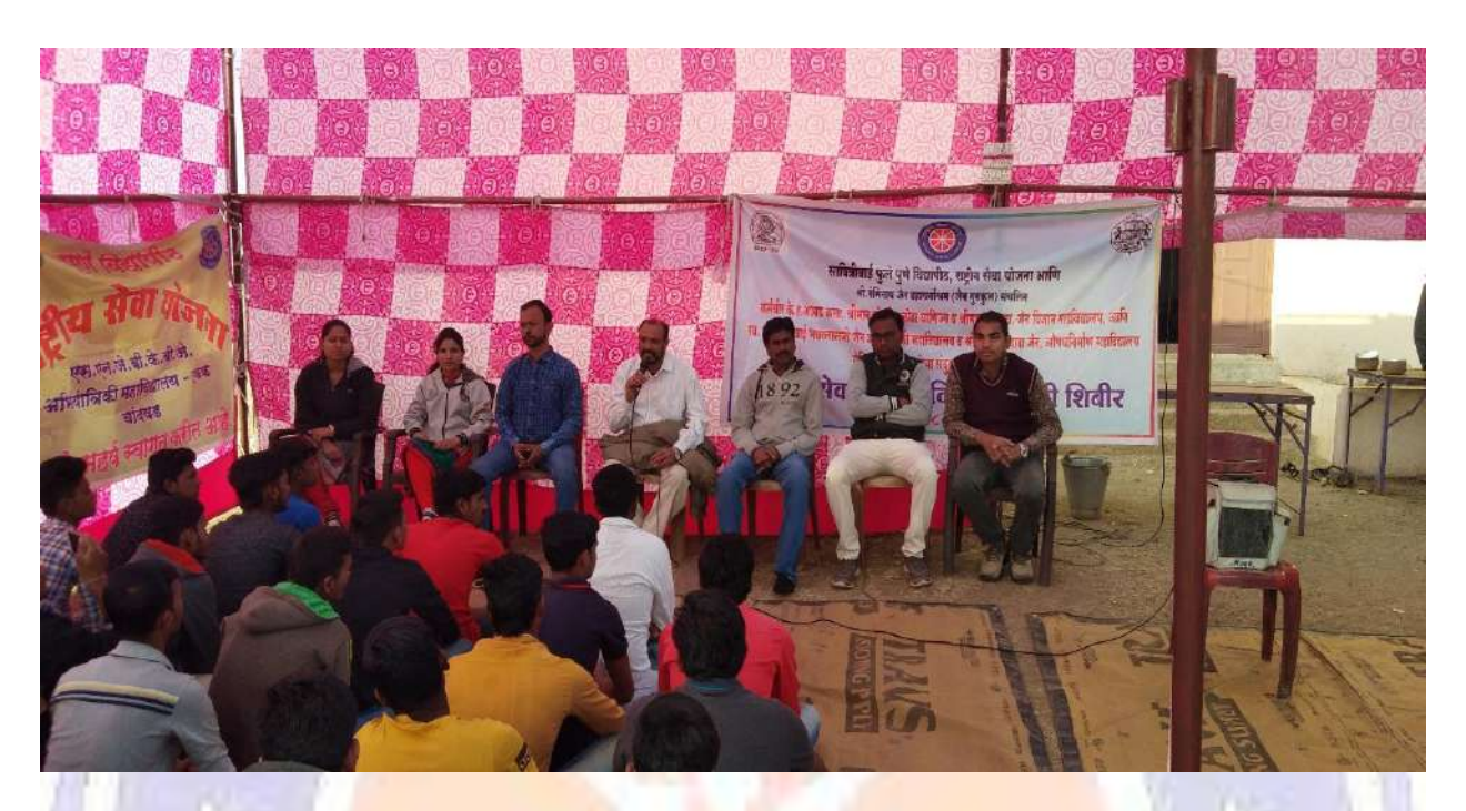
Winter Special Camp at Bhoyegaon