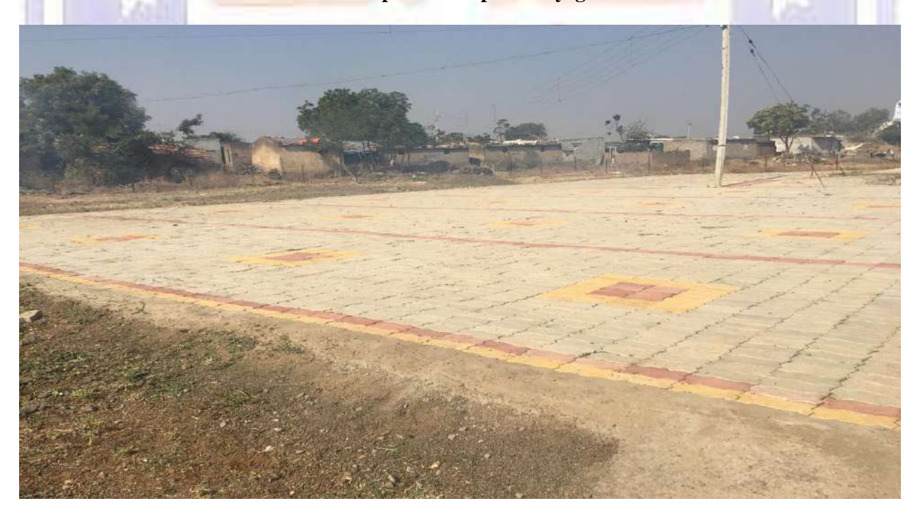
Winter Special Camp at Bhoyegaon