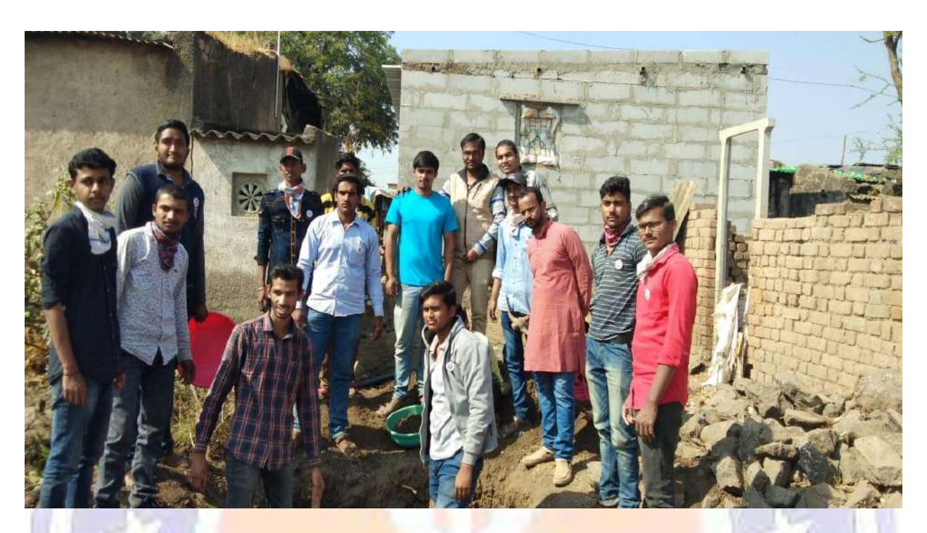
Winter Special Camp at Bhoyegaon