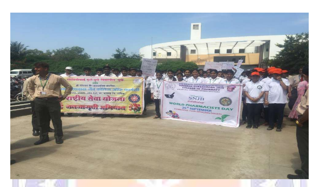
World Pharmacist Day Celebration