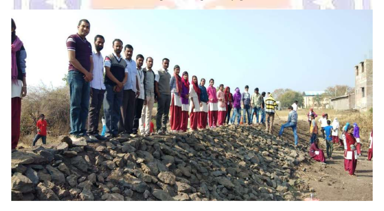
Winter Special Camp at Bhoyegaon